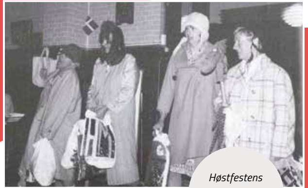
Høstfestens dygtige skuespillere

Siden den spæde start i 1947 har KFUKs Sociale Arbejde været drevet af den ultimative donation – nemlig donationen af tid og kræfter. Men man kunne desværre ikke drive organisationen på frivillige kræfter alene, så andre tiltag måtte tages i brug. I 1986 udvidede vi kontoret med en generalsekretær, en landssekretær og en halvtidsansat bogholder. I 2022 sidder der 14 medarbejdere på Hovedkontoret og understøtter over 500 medarbejdere, vikarer og frivillige fordelt på 14 forskellige institutioner.