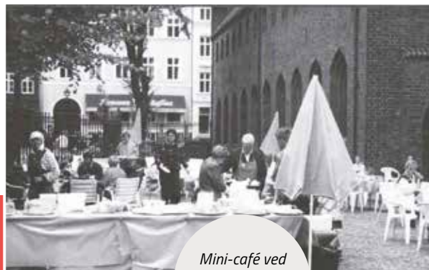
Mini-café ved Helligåndskirken i København