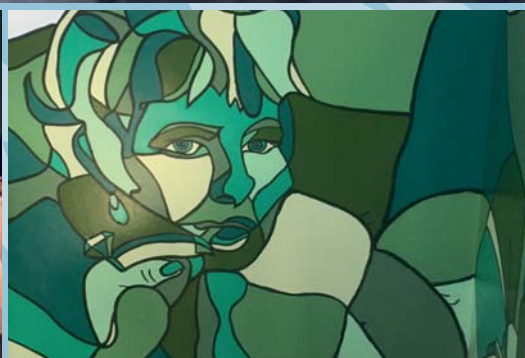
Fernisering i Kontaktcentret