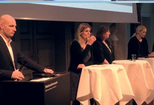
Konference om sugardating på Nationalmuseet