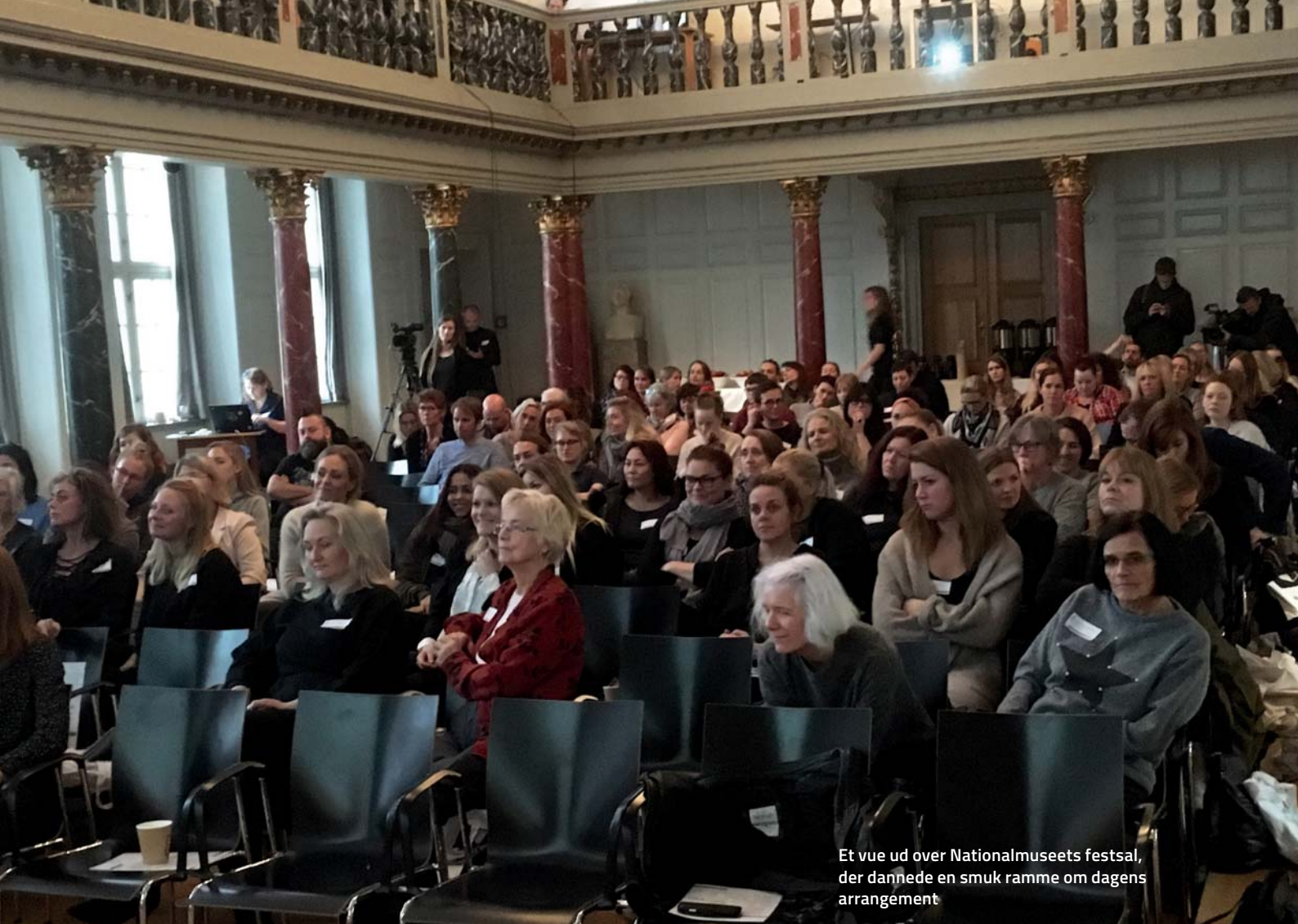
Et vue ud over Nationalmuseets festsal, der dannede en smuk ramme om dagens arrangement

Forstander for Reden København, Kira West, opsummerede arbejdet og anbefalingerne således: